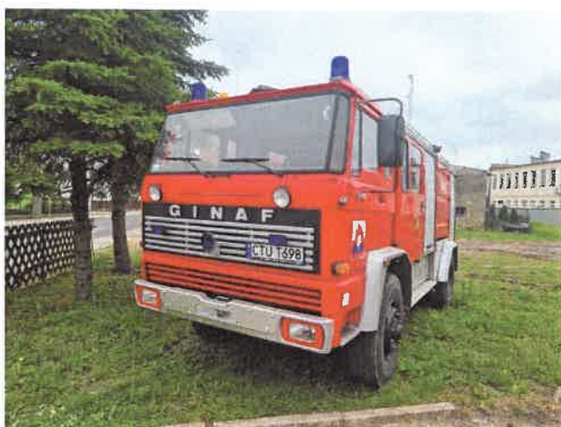
Dok. fot. z dnia 24.05.2024r. fot. nr 3