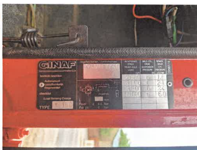
Dok. fot. z dnia 24.05.2024r. fot. nr 16