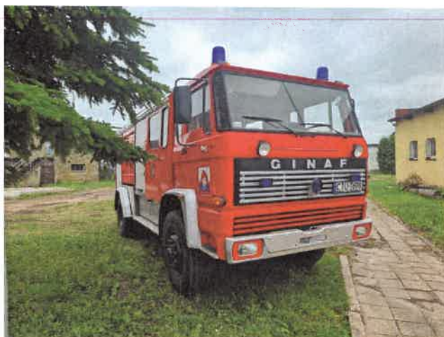
Dok. fot. z dnia 24.05.2024r. fot. nr 1