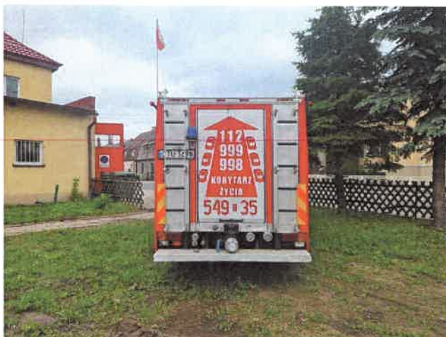
Dok. fot. z dnia 24.05.2024r. fot. nr 7