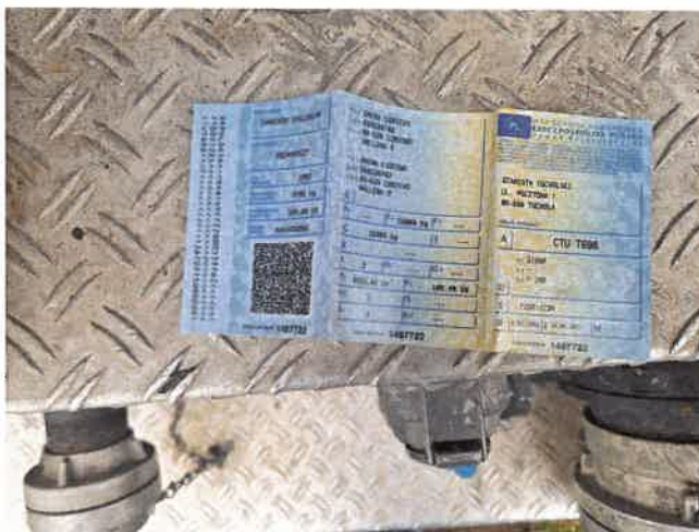
Dok. fot. z dnia 24.05.2024r. fot. nr 23