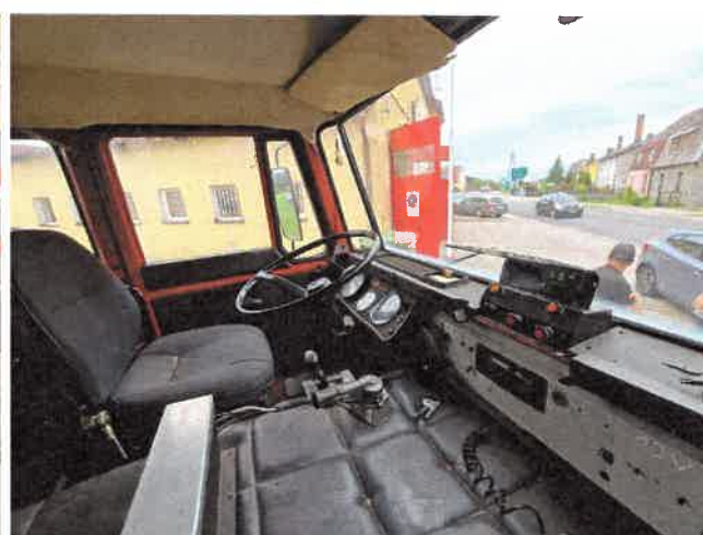
Dok. fot. z dnia 24.05.2024r. fot. nr 12