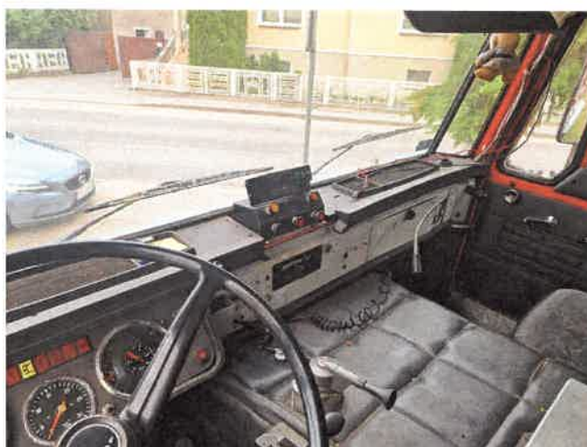
Dok. fot. z dnia 24.05.2024r. fot. nr 11