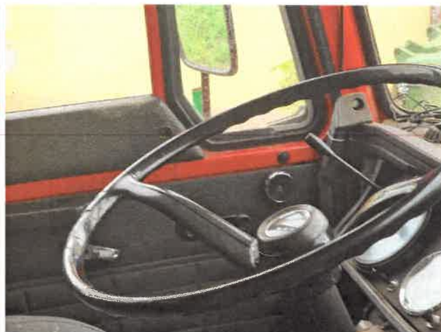
Dok. fot. z dnia 24.05.2024r. fot. nr 14