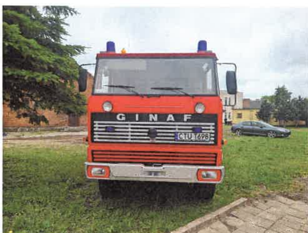
Dok. fot. z dnia 24.05.2024r. fot. nr 5