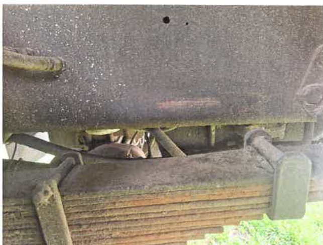
Dok. fot. z dnia 24.05.2024r. fot. nr 17