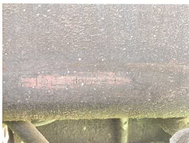
Dok. fot. z dnia 24.05.2024r. fot. nr 18