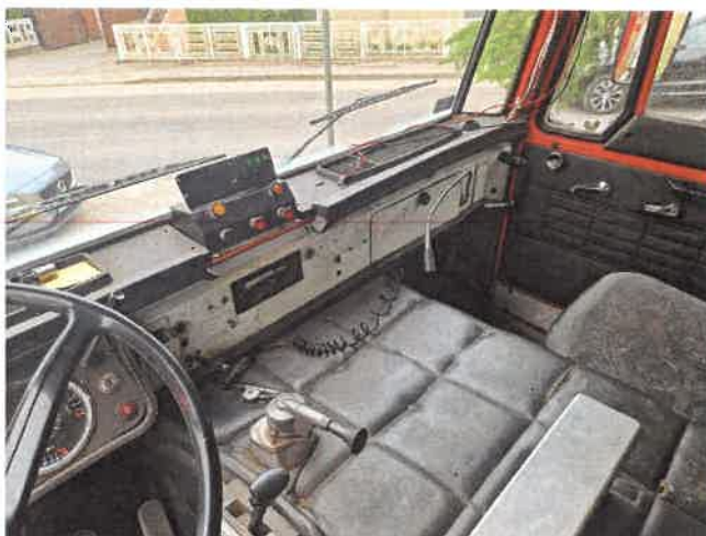
Dok. fot. z dnia 24.05.2024r. fot. nr 13