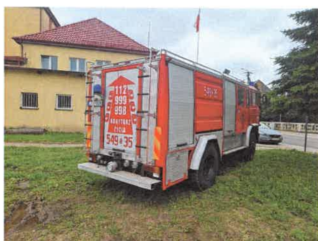
Dok. fot. z dnia 24.05.2024r. fot. nr 4