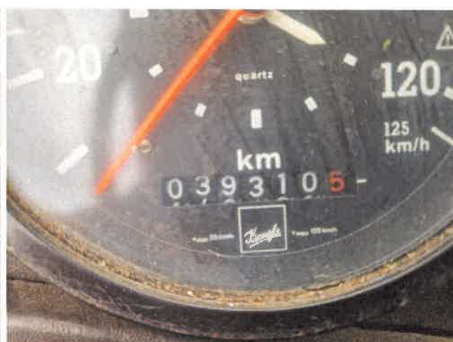
Dok. fot. z dnia 24.05.2024r. fot. nr 10