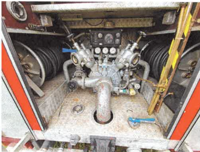
Dok. fot. z dnia 24.05.2024r. fot. nr 21