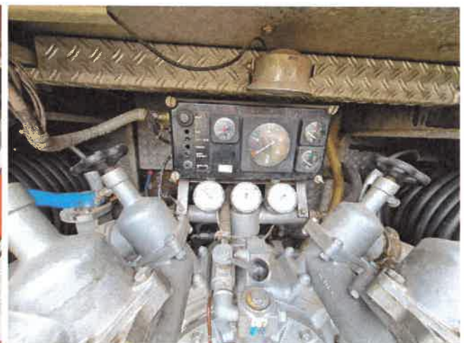
Dok. fot. z dnia 24.05.2024r. fot. nr 22