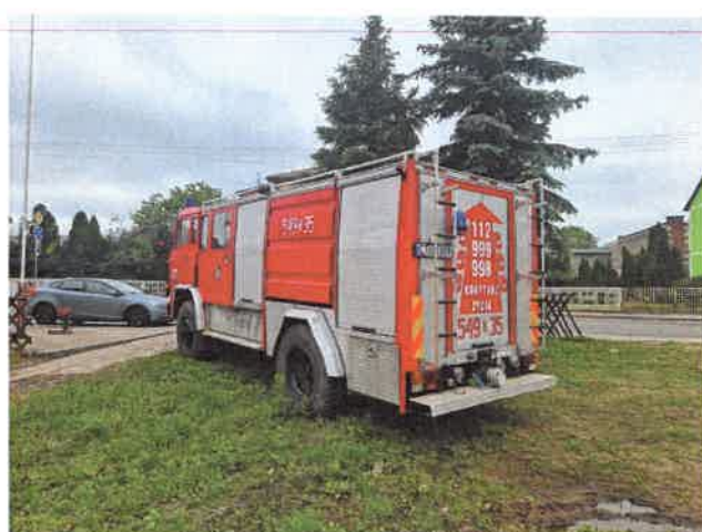
Dok. fot. z dnia 24.05.2024r. fot. nr 2