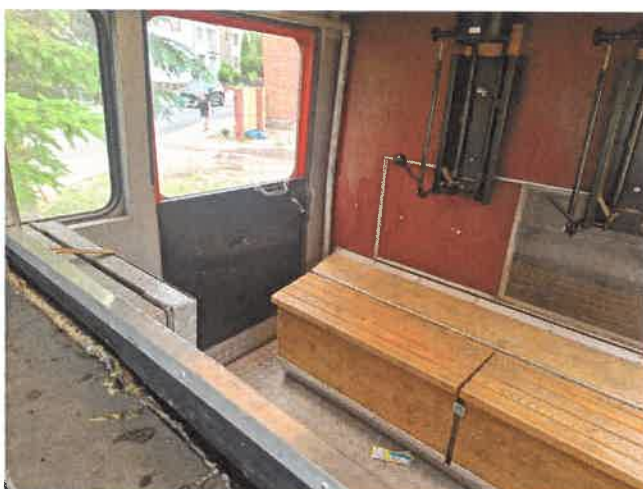
Dok. fot. z dnia 24.05.2024r. fot. nr 15