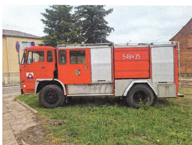
Dok. fot. z dnia 24.05.2024r. fot. nr 6