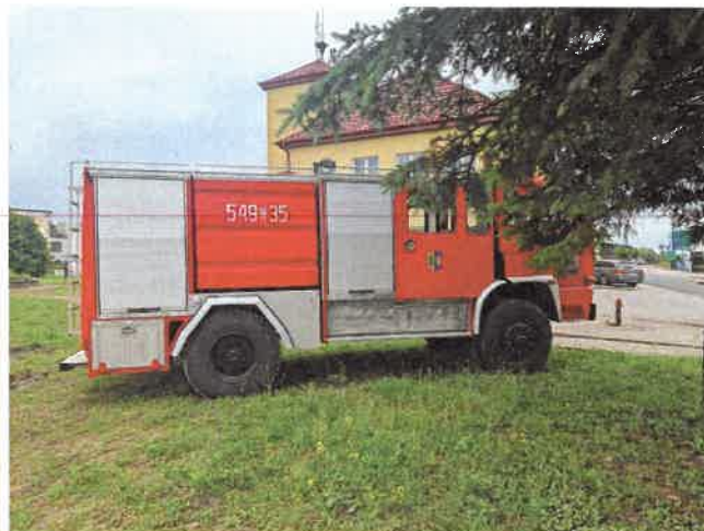
Dok. fot. z dnia 24.05.2024r. fot. nr 8