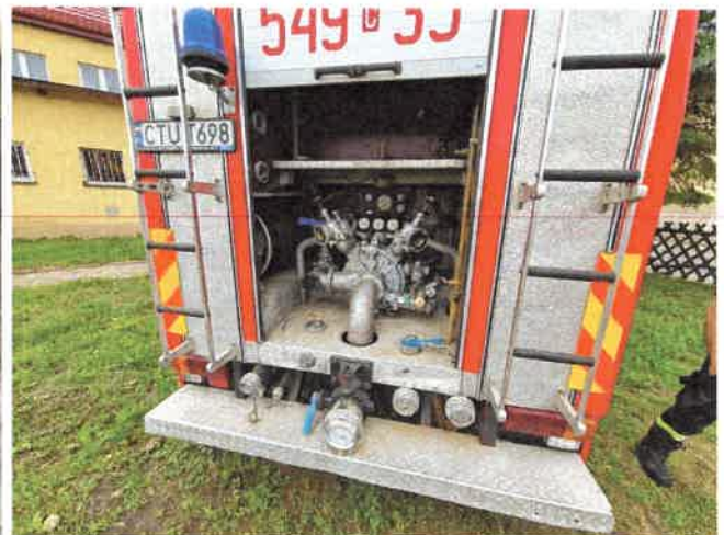
Dok. fot. z dnia 24.05.2024r. fot. nr 20