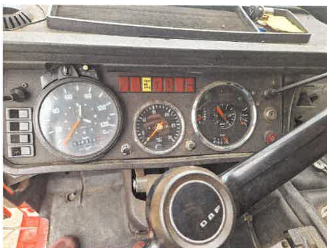
Dok. fot. z dnia 24.05.2024r. fot. nr 9